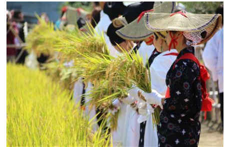
9月30日開催「抜穂祭」の様子