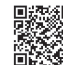
八代市文化祭について