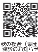
秋の複合(集団)健診のお知らせ