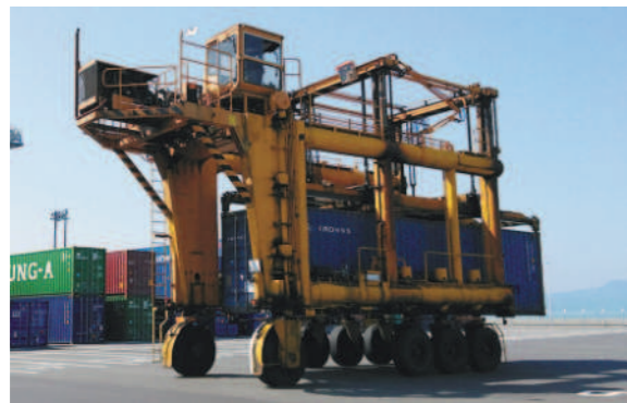
輸送コンテナの移動などを行うストラドルキャリア

また令和2年には、クルーズ専用岸壁が完成し、大型クルーズ船の受け入れが可能となったことで、人流の拠点としても発展を続けており、この春からは多くの旅行者によるにぎわいも見え始めています。