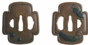
茄子図鐔 江戸時代末期(19世紀) 八代市立博物館所蔵

観覧料 一般310円、高大200円 ※中学生以下、障がい者手帳などを提示の人は無料