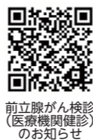
前立腺がん検診(医療機関健診)のお知らせ