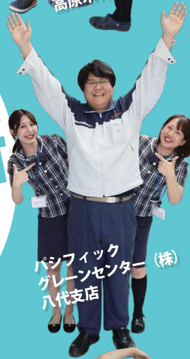
パシフィック グリーンセンター (株) 八代支店