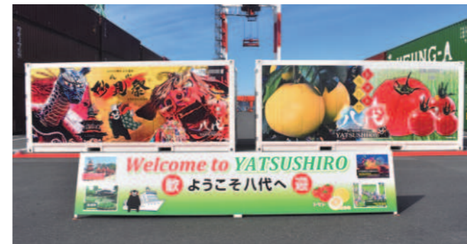
台湾航路などで本市をPRするラッピングコンテナ

令和5年8月下旬から、八代港と台湾を結ぶ国際コンテナ定期航路が改編され、台湾からの輸入が約10日から4日に短縮され、八代港の利便性が大きく向上しました。