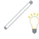
Fluorescent tube (lamp), bumbilya. Hanggang 20 bawat araw