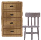
Mga kasangkapang bahay at mga bagay gawa sa kahoy. Hanggang 5 bawat araw

<Halimbawa at limitasyon sa dami ng pagtapon ng mga mailalabas bilang malaking basura>