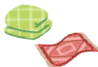
Mga futon, carpet, Kutson (walang bakal) Hanggang 5 bawat araw