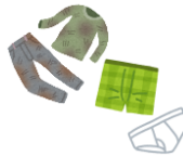
Maruruming damit, damit na panloob