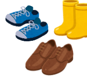
Rubber shoes, balat na sapatos, bota atbp.