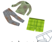
Quần áo bẩn, đồ lót