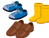
Giày thể thao, giày da, ủng