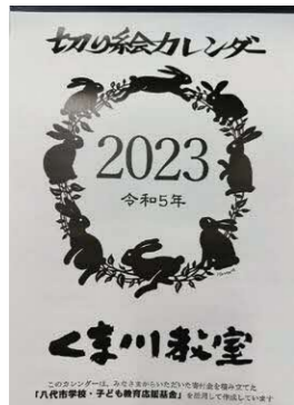
くま川教室作成の切り絵カレンダー