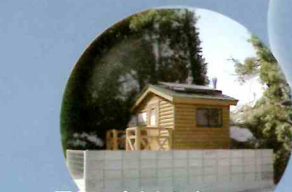
黒島のパイオトイレ 八代海の沖に浮かぶ無人島の中島と黒島が現在、舟出浮きの基地として整備されています。