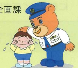
熊本県警シンボルマスコット ゆっぴー