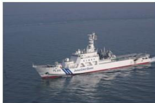
↑海上保安庁巡視船「こしき」