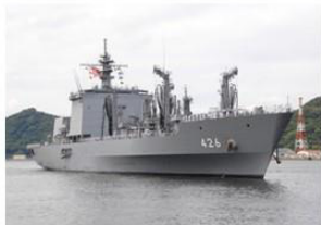
↑海上自衛隊補給艦「おうみ」