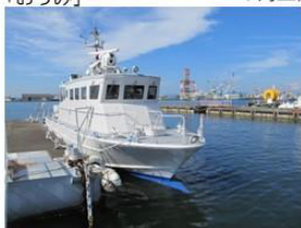
↑八代税関支署小型監視艇「ありあけ」