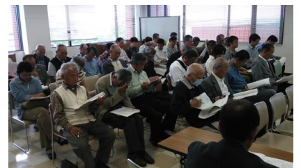
— 総会参加の代議員の方々 —