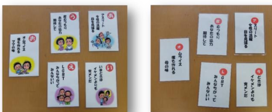
↑八代みらいネットオリジナル啓発グッズ↑ 「ジェンダーかるた」

E-mail gender-equal@city.yatsushiro.lg.jp