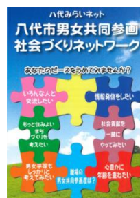
↑リーフレット表紙↑