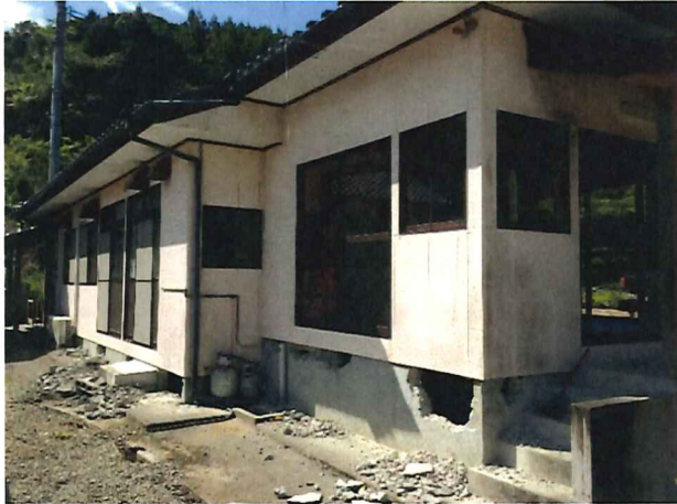
①基礎部分の縁切り