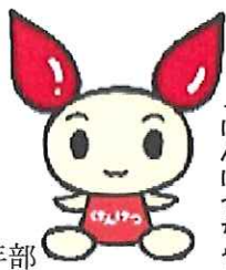
献血キャラクター「けんけつちゃん」

期 日：7月16日(木) 時 間：午前9時30分～12時 午後1時～4時 会 場：鏡支所正面玄関横 協力団体：八代郡自動車整備組合青年部