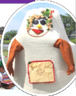
ゆるキャラ 愛ちゃん 登場