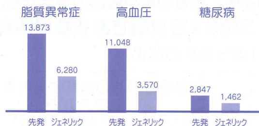
薬価・負担額の比較(例) 単位:円 (3割負担・365日服用・1日1錠服用の場合)

※上記は令和4年4月現在の比較例です。 ※日本ジェネリック医薬品・バイオシミラー学会のデータに基づき作成。 ※ジェネリック医薬品代は、高いタイプと安いタイプの平均で記載しています。