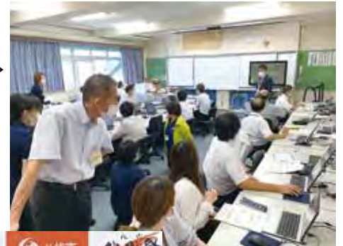
ICT授業サポーター による教職員向け研修会

今後も授業やクラブ活動への協力、学校外の専門団体との連携をとってICT活用の推進を図っていきます。