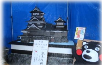
作品題名 「熊本復興」 出展団体 町4常会・町14常会

7月18日(水)に鏡町の初夏を彩る恒例の十八夜祭がアーバン駐車場をメイン会場として開催されました。十八夜祭は、子授け、安産、子育て、良縁などで有名な子安観音に造り物が奉納される、数百年の歴史がある夏祭りです。