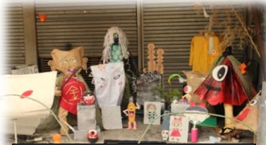
出展団体 津口子ども会