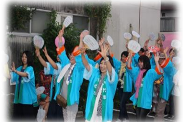
八代市職員互助会