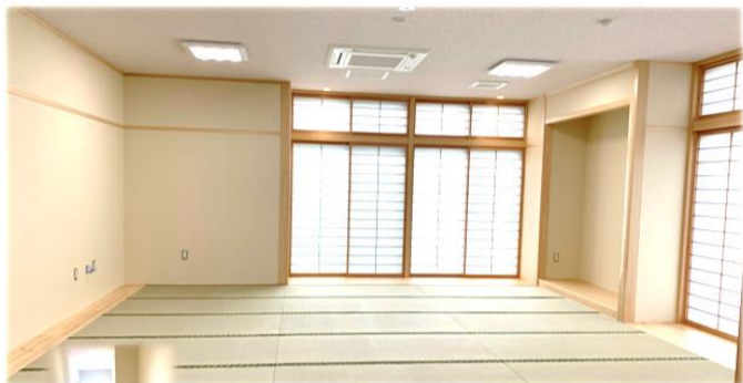
【和室】 24畳 44.6㎡