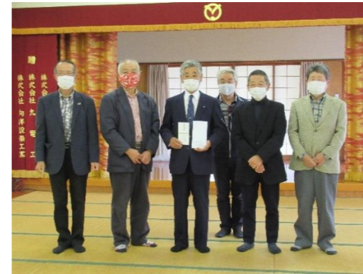
まちづくり協議会みやじ様

「まちづくり協議会みやじ」様、「宗覚寺」様（宮地町）より坂本住民自治協議会がお見舞金を頂きました。