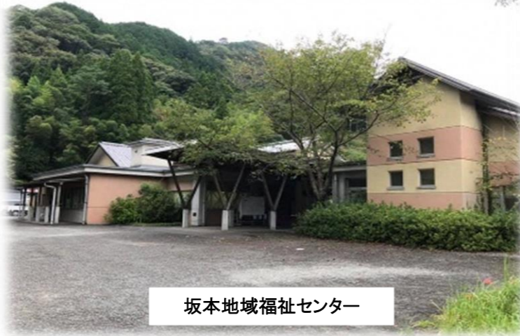
坂本地域福祉センター

《新住所》〒869-6115 八代市坂本町荒瀬1307 (坂本地域福祉センターに入って左側にあります)