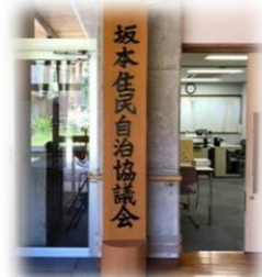
坂本住民自治協議会 看板