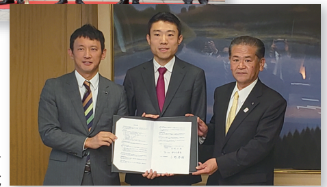
お金の家庭教師 立地協定調印式

企業の新設、増設などにおける工場への投資を応援するための固定資産税の減免や課税免除、事業所等建設補助金、用地取得等補助金、雇用奨励金など