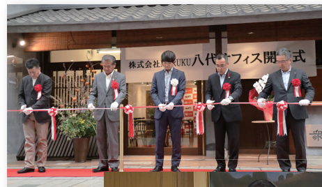
MARUKU 八代オフィス 開所式

また、企業からの固定資産税や法人市民税、個人所得の増加による個人市民税など、市の税収の増加につながり、市民サービスを提供するための財源確保につながります。