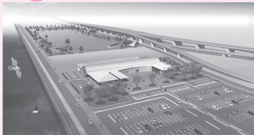
▲JRA（日本中央競馬会）の場外馬券発売所「ウインズ八代（仮称）」について、市とJRAで土地売買契約の締結式を行いました。来年4月のオープン予定です。