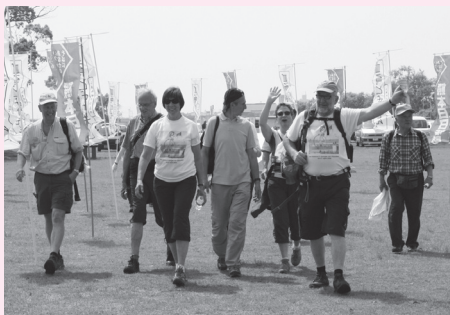
▶今年で16回目となる「九州国際スリーデーマーチ 2010」に、海外11カ国からの182人を含む約2万人が参加。8日には八代よかご大使として同大会に参加されていた八代亜紀さんのデビュー40年を記念したチャリティーコンサートも開催されました。