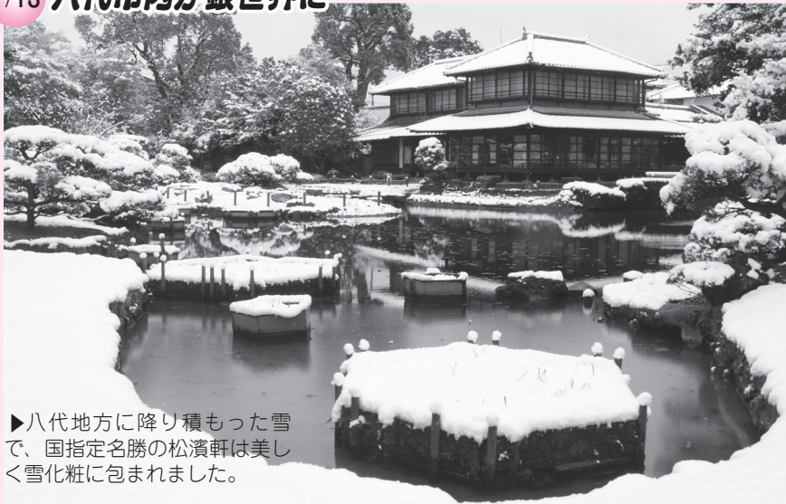
▶八代地方に降り積もった雪で、国指定名勝の松濱軒は美しく雪化粧に包まれました。

この1年間、「広報やつしろ」ではさまざまな市内の出来事をお伝えしてきました。1年間の思い出となる話題を振り返ります。