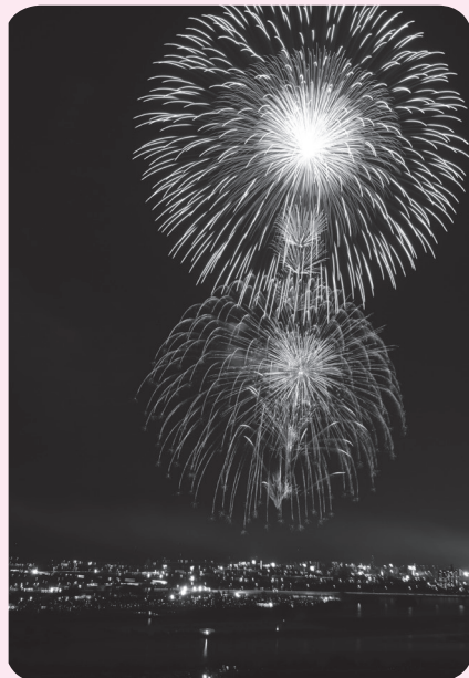
▲ 10 月 16 日 来年 3 月の九州新幹線全線開業のイベントとして開催され、全国 30 社の花火師たちが技術の粋を集めた約 13,000 発の花火に、29 万人の観客が酔いしれました。