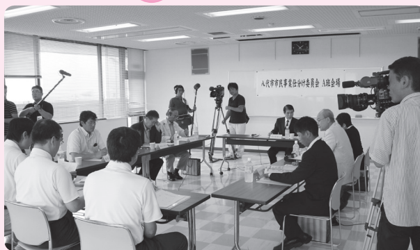
◀平成 22 年度に市が行う 1,050 事業のうち 75 事業を、公共的団体や有職者、公募などで選ばれた 35 人の市民の視点で、事業内容の評価・見直しを行いました。