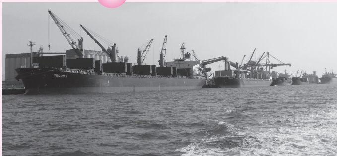
▲八代港が国の「重点港湾」に選定され、本市のみならず、熊本県、そして県南地域の振興に大きな期待が寄せられています。