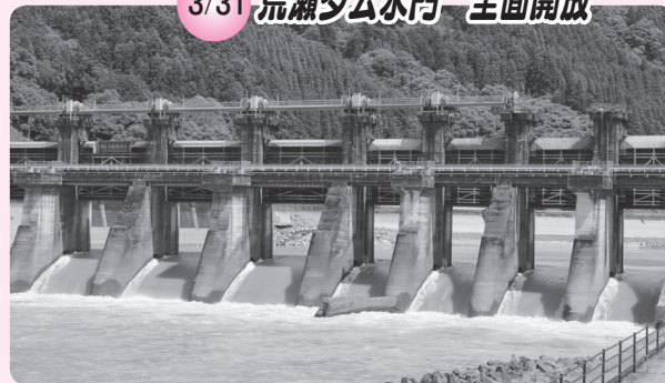
▲県営荒瀬ダムは、発電事業の役目を終え、全国で初めてダム撤去に向けて動き出しました。