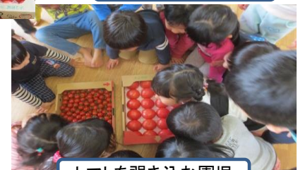
トマトを覗き込む園児