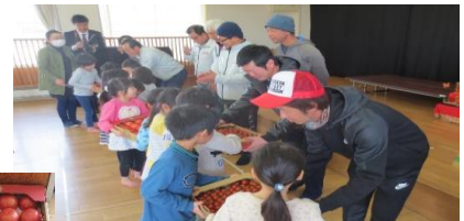
鏡保育園で贈呈式