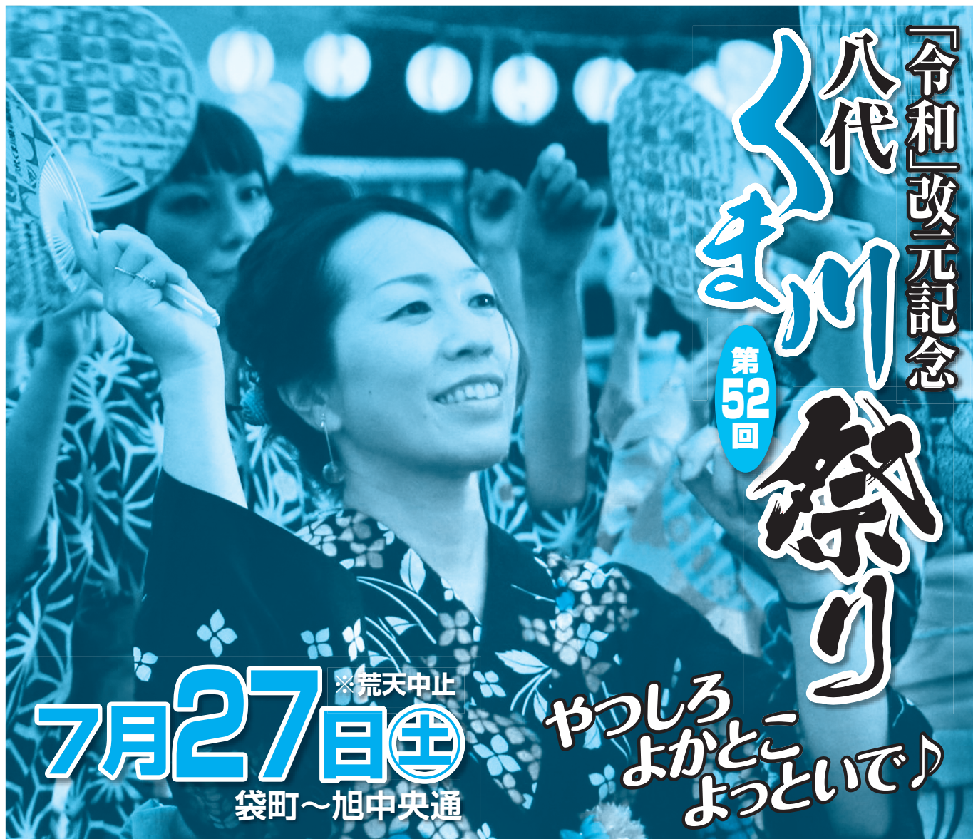
▲写真は昨年のフォトコンテスト一眼レフ部門一席の作品