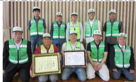
鏡まちづくり協議会「地域安全部会」のみなさん

鏡まちづくり協議会が、日頃の地域安全活動に功を認め、熊本地震の時、被災者の大きな役割を果たした。受賞おめでとうございました。 また、熊本地震の時、被災者の大きな役割を果たした。受賞おめでとうございました。 また、熊本地震の時、被災者の大きな役割を果たした。受賞おめでとうございました。