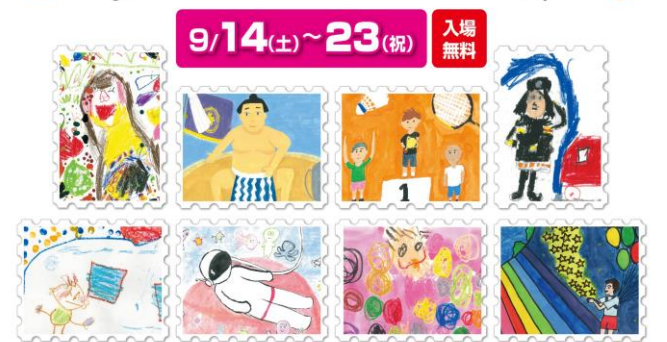
【テーマ：わたしの夢】(2歳から) 熊本市:4歳/八代市:中2/八代市:中2/長野県:小2 (7歳から) 八代市:5歳/八代市:中1/八代市:3歳/八代市:小4

オープニングセレモニー & アトラクション 9月14日(土) 開場9:00 開演9:45 会場 さかもと館・道の駅坂本 アトラクション ①未来に贈る! 夕暮太鼓(夕暮保育園園児) ②一緒に踊ろう! フラダンス(リウ・ファン・フー・ピカスタジオ) ③武勇の名演(大橋孝俊) ④楽しい二次元ドラマ(紙芝居・絵本) ⑤松野オッチャンの不思議な手品(熊不明)