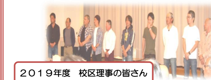
2019年度 校区理事の皆さん