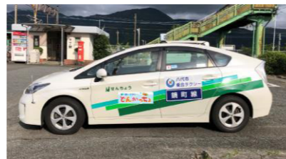
【運行車両のイメージ】