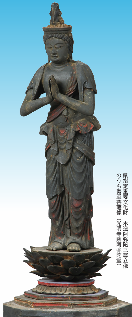
県指定重要文化財 本造阿弥陀三尊立像のうち勢至菩薩像(光明寺跡阿弥陀堂)

八代には、国や県、市によって指定・選択・登録された文化財が239件(平成29年6月現在)あります。