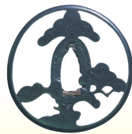
県指定重要文化財 三階松透鐺 林又七作(博物館所蔵)