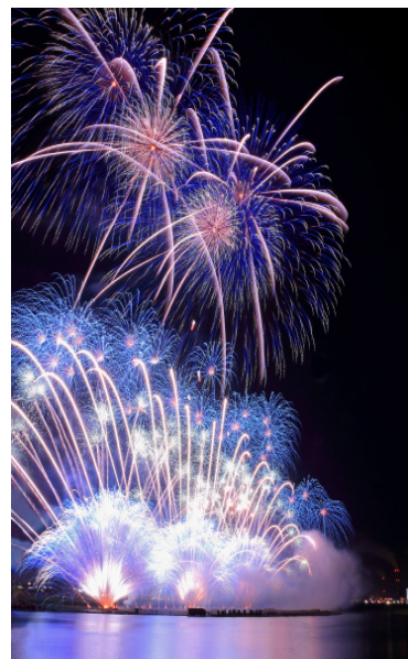
最優秀賞作品 フルライトやつしろ