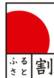
<ふるさと割マーク>