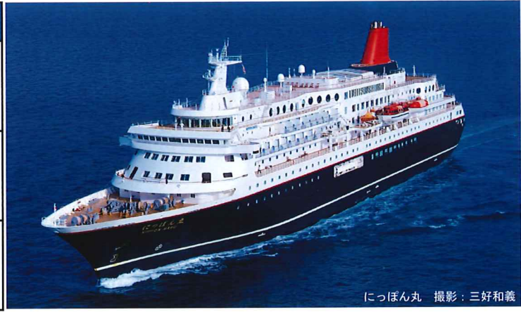
にっぽん丸