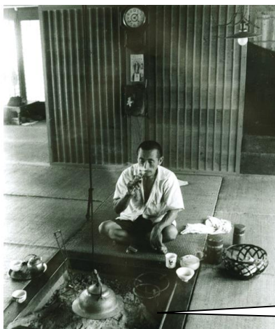
八代市東町 昭和24年