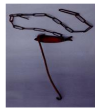
②じざいかぎ(自在鉤)

柱にかけて使った時計。ネジをまかないと止まってしまうので、定期ききにネジをまきました。