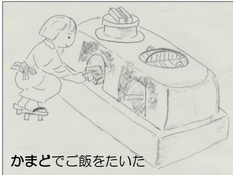
かまどでご飯をたいた

今のようなべんりな道具のなかったころは、どんなくらしをしていたんだろう？ 今から6~70年前、みんなのおじいさんやおばあさんが子どものころにつかわれていた道具から、そのころの人たちのくらしを考えてみよう。