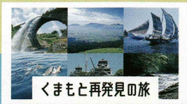
くまもと再発見の旅