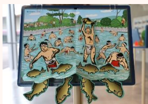
当館エントランスにあるとび出す絵本でも紹介中

新型コロナウイルス感染症対策のため、4年間で中止となっていました。鏡が池にあの賑わいが戻ります!