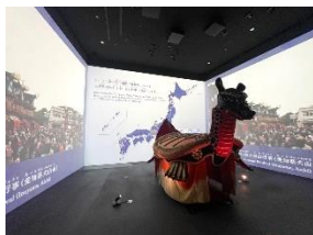
ユネスコ無形文化遺産 「山・鉾・屋台行事」

今回の映像は、笠鉾が展示されている期間も見やすいように工夫されているし、11月22日のお下りの様子や、23日の笠鉾の出発や解体の様子、最後の札の辻の獅子舞までより詳しい妙見祭の紹介映像になっているわ。そして、まるでその場にいるみたいな気分になる臨場感あふれる音もぜひ感じて欲しいと思っているの。ぜひ見に来てね