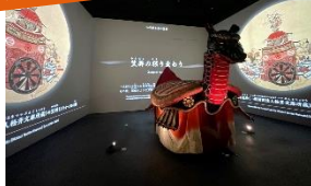
八代妙見祭の笠鉾