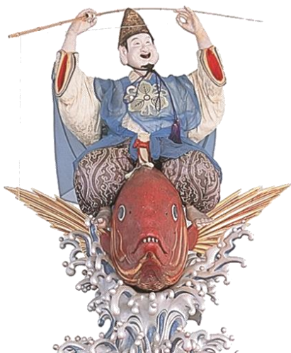
↑ 笠鉾恵比須。江戸時代の明和元年（1764） 八代の14歳の大工が作った波の台と鯛。